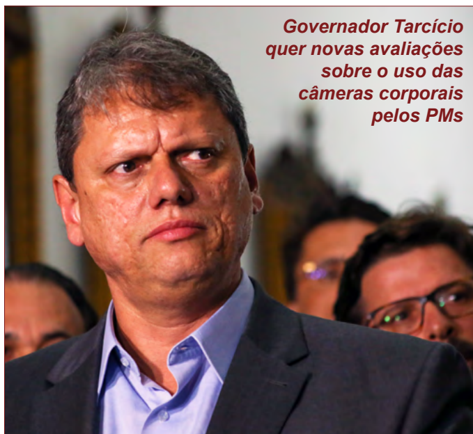
Governador Tarcísio quer novas avaliações sobre o uso das câmeras corporais pelos PMS